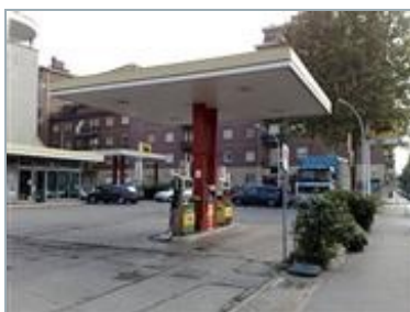
MILANO Via Gallarate 40